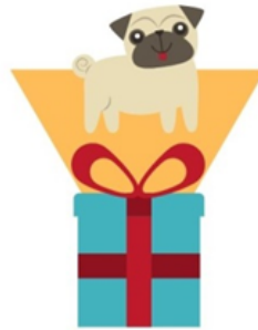
ein schöneres Geschenk