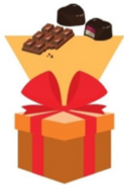
ein schönes Geschenk