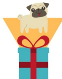
ein schöneres Geschenk