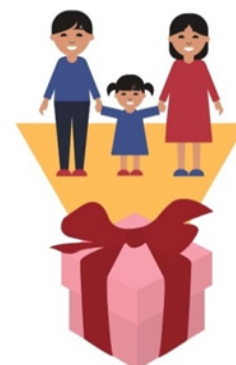
das schönste Geschenk