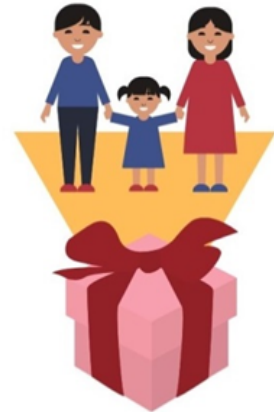
das schönste Geschenk