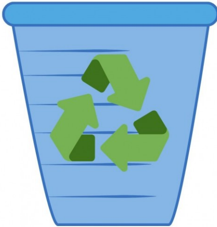
Papier und Pappe