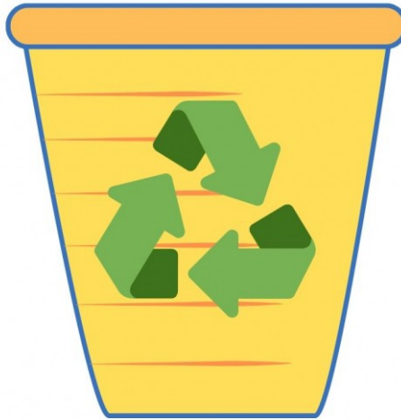
Plastik und Metall