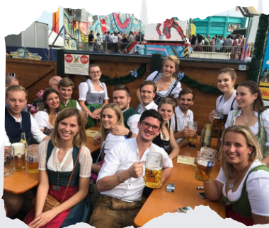
Nina mit ihren Freunden auf dem Oktoberfest

etwas empfehlen - iets aanraden die Umgangssprache - de spreektaal spezifisch - speciaal ein Angebot nutzen - gebruik maken van een aanbod die Freundschaft(-en) - de vriendschap