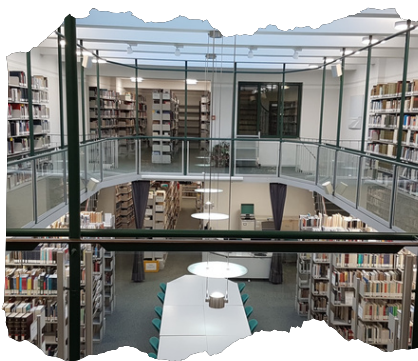
Bibliothek im Haus der Niederlande

Während meiner ersten Woche in Münster wurde ich direkt mit der Tatsache konfrontiert, dass ich in Deutschland wohne. Das kurze Radfahren auf dem Bürgersteig wurde durch das Gemurmel von Fußgängern streng abgelehnt. Auch der Seufzer, den ich machte, als ich hörte, dass die Hausaufgaben in zweifacher Ausführung auf Papier gedruckt werden sollen, wurde nicht geschätzt. Positiv war jedoch die Möglichkeit des direkten Kontakts mit den Dozierenden. Man konnte ganz einfach mit einer Frage über zum Beispiel Vorlesungen oder die Abschlussarbeit in ihrem Büro vorbeikommen.