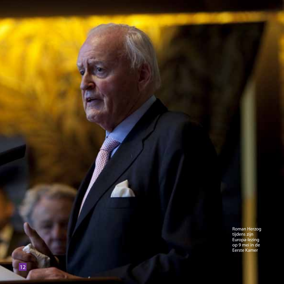
Roman Herzog tijdens zijn Europa-lezing op 9 mei in de Eerste Kamer