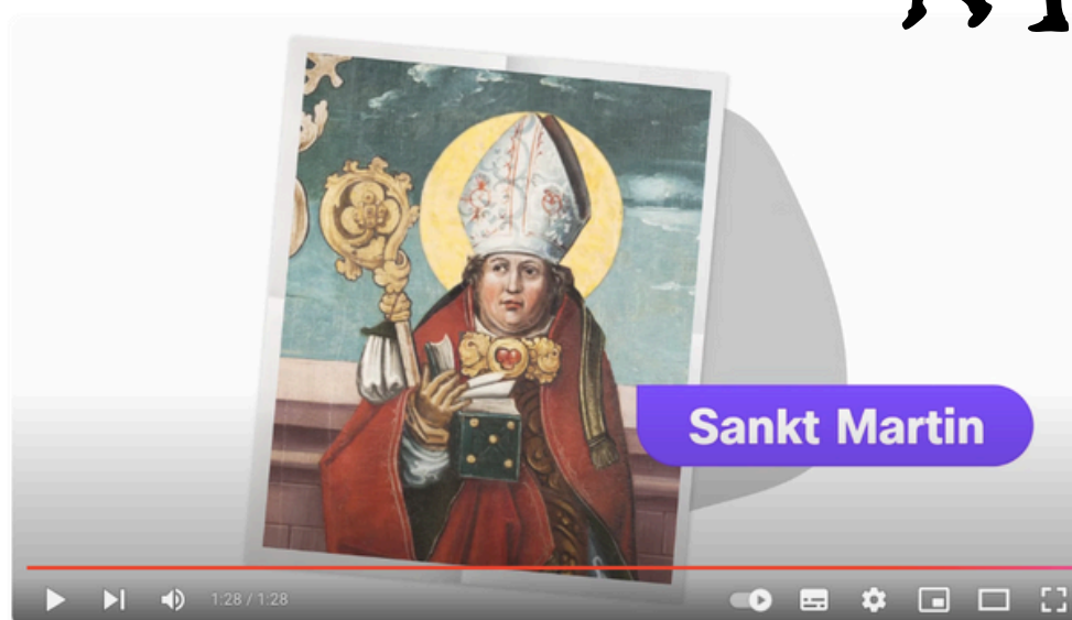
Wer Sankt Martin eigentlich war - logo! erklärt - ZDFtivi