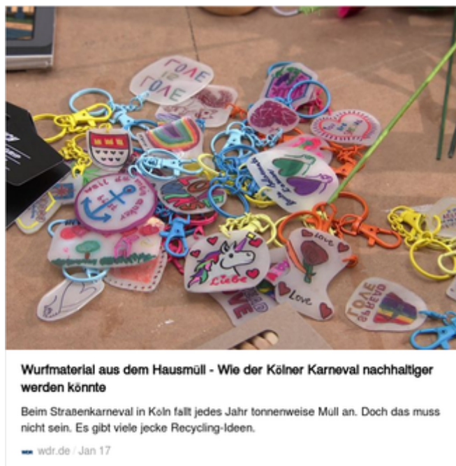
Wurfmaterial aus dem Hausmüll - Wie der Kölner Karneval nachhaltiger werden könnte

Beim Straßenkarneval in Köln fällt jedes Jahr tonnenweise Müll an. Doch das muss nicht sein. Es gibt viele jecke Recycling-Ideen.