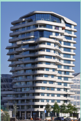
Marco Polo Tower

2) Schattingsvraag: Hoeveel zeeschepen bereiken per jaar de Hamburger Hafen?