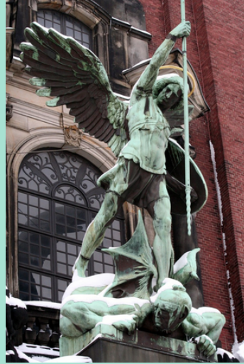
Foto 2: St. Michaeliskirche