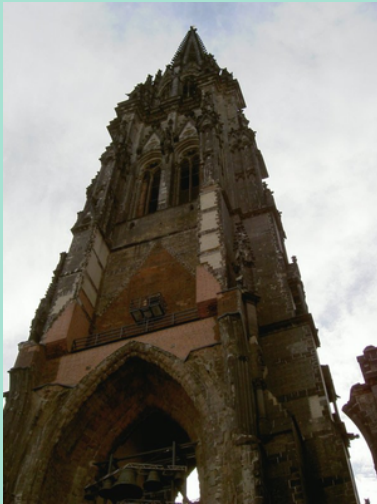
Foto 3: St. Nikolaikirche