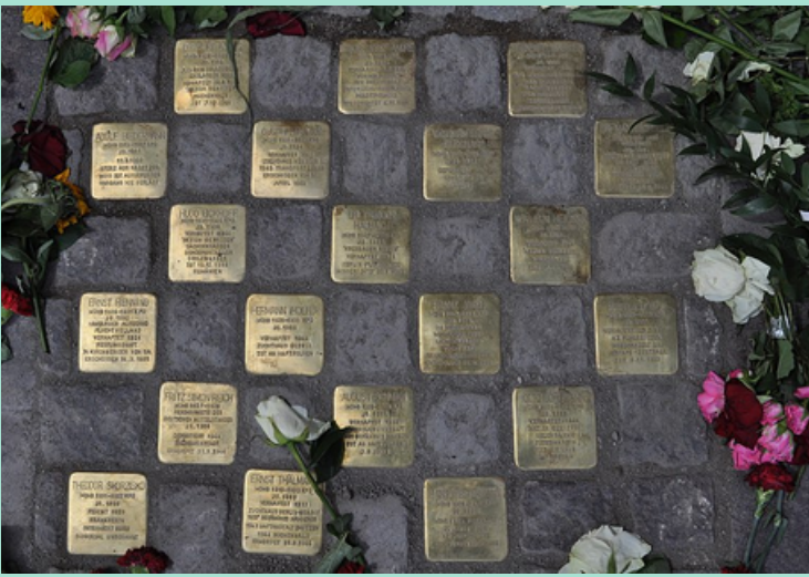
Foto 7: Stolpersteine beim Rathaus